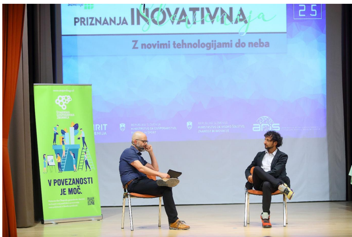
4.3. Razstava izbora najboljših inovacij – javna predstavitev nagrajenih inovacij.